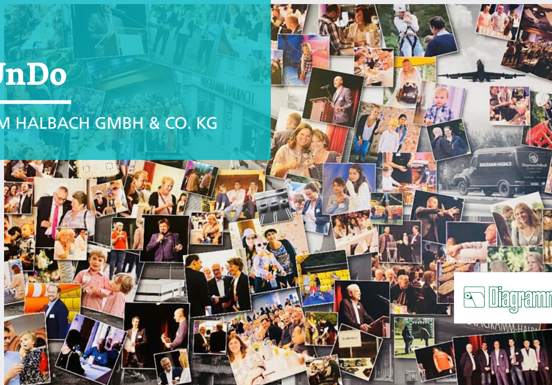
DIAGRAMM HALBACH GMBH & CO. KG

Mit den Geschäftsfeldern Healthcare und Sicherheitsdruck sind wir als Diagramm Halbach in zwei zukunftsorientierten und anspruchsvollen Marktbereichen tätig. Unter Healthcare verstehen wir Produkte für das Gesundheitswesen: Medizinische Papiere, Etiketten für die Labordiagnostik oder Zubehörprodukte für die Medizintechnik. Die 3.000 Medizinprodukte in unserem Sortiment unterstützen eine hohe diagnostische Qualität im Krankenhaus und verbessern die Patientensicherheit.